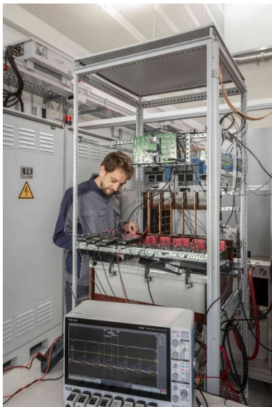
Aufbau und Test des SiC-Wechselrichter-Stacks in den Labors des Fraunhofer ISE

Die Fraunhofer-Gesellschaft ist die führende Organisation für angewandte Forschung in Europa. Unter ihrem Dach arbeiten 74 Institute und Forschungseinrichtungen an Standorten in ganz Deutschland. Mehr als 28 000 Mitarbeiterinnen und Mitarbeiter bearbeiten das jährliche Forschungsvolumen von mehr als 2,8 Milliarden Euro. Davon fallen 2,3 Milliarden Euro auf den Leistungsbereich Vertragsforschung. Über 70 Prozent dieses Leistungsbereichs erwirtschaftet die Fraunhofer-Gesellschaft mit Aufträgen aus der Industrie und mit öffentlich finanzierten Forschungsprojekten. Die internationale Zusammenarbeit wird durch Niederlassungen in Europa, Nord- und Südamerika sowie Asien gefördert.